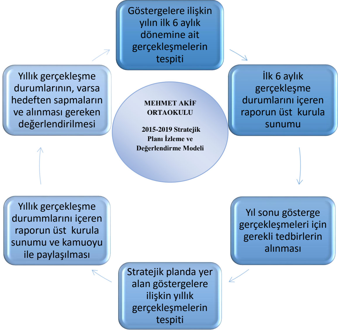
Şekil 3: Stratejik Planı İzleme ve Değerlendirme Modeli